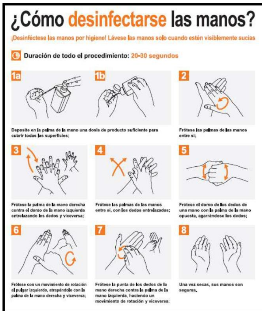
Figura 1. Cartel de técnica de la desinfección o higiene de manos.