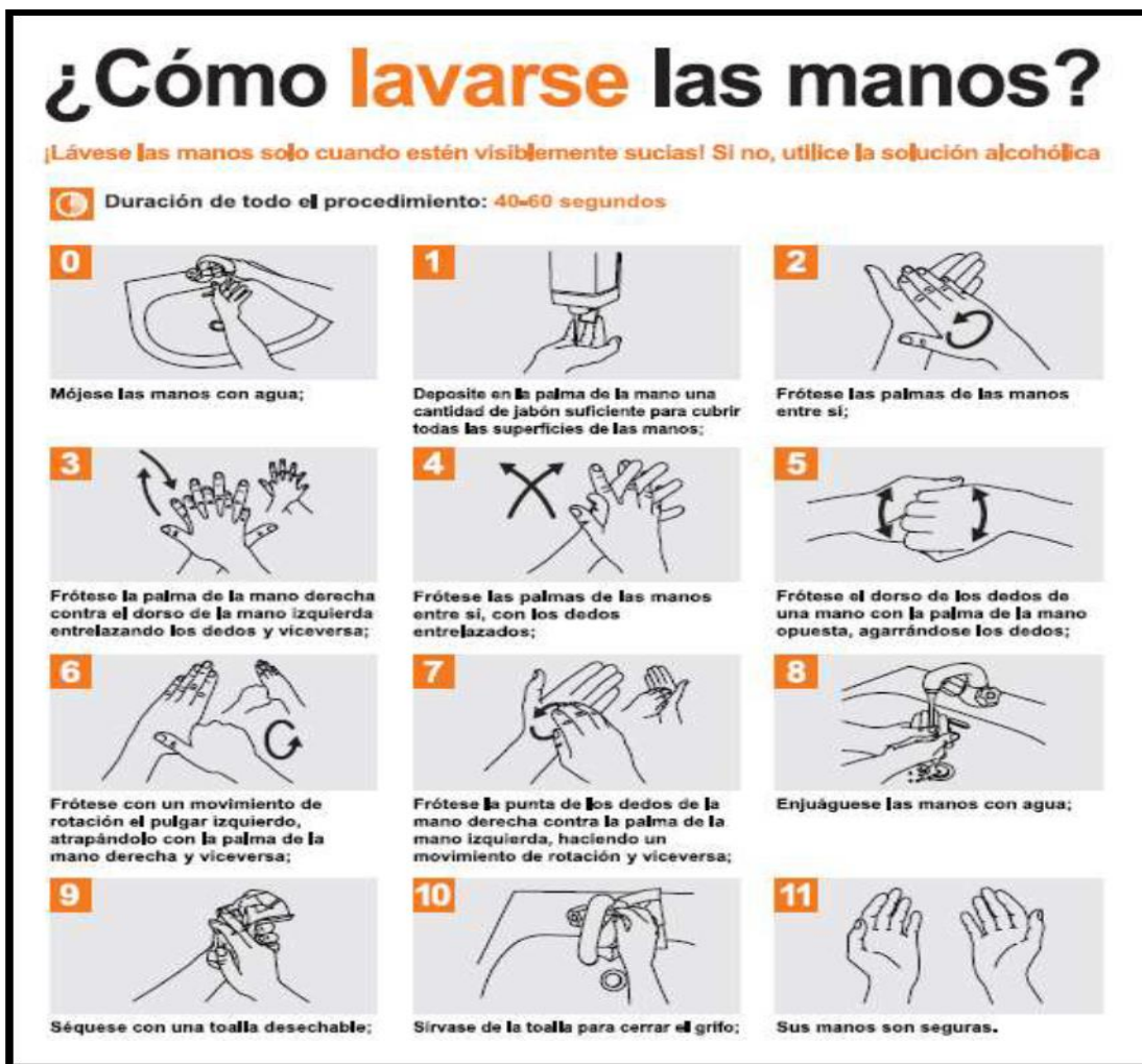
Figura 2. Cartel de técnica de lavado de manos.